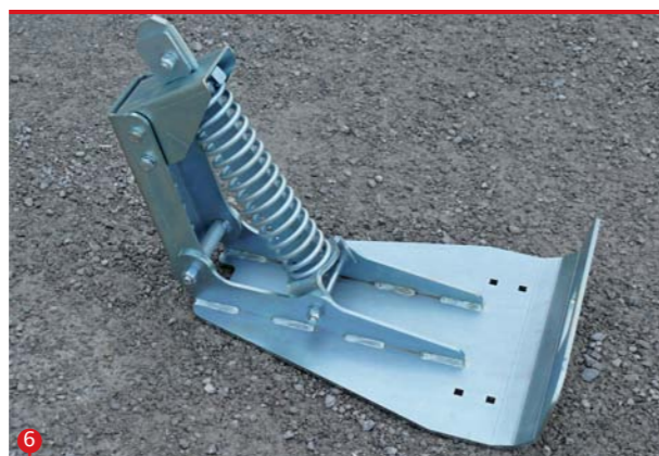
6 "PŁETWA" UGNIATAJĄCA Прижимные лапы Potirači tragova Лапи за притискане на стъблата