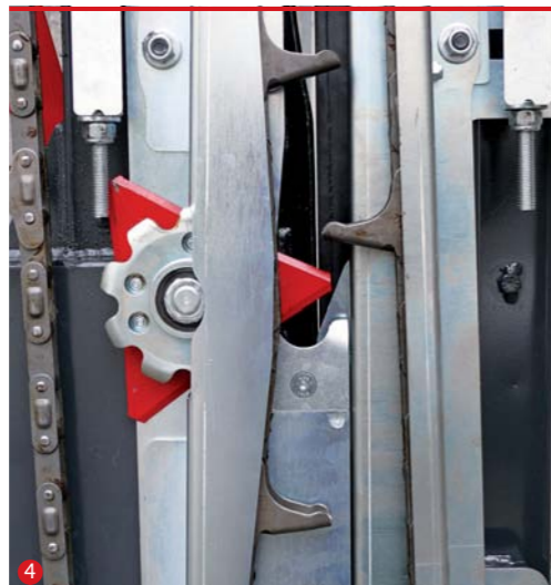
4 ZESTAW DO ZBIORU SŁONECZNIKA Набор для уборки подсолнечника Komplet za suncokret Комплекът за слънчоглед