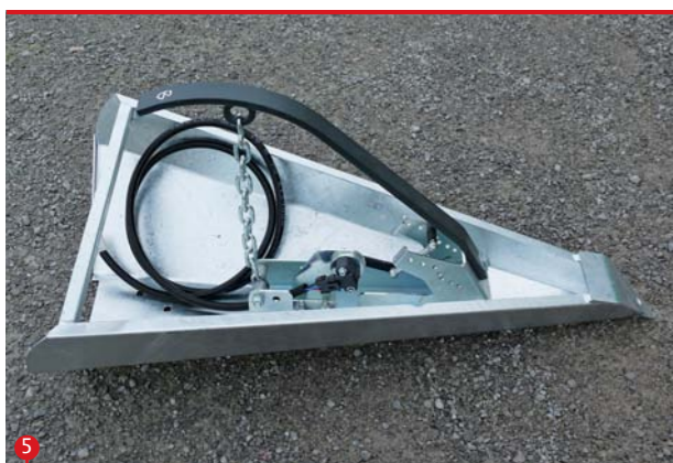
5 SYSTEM POZIOMOWANIA PRZYSTAWKI Набор сенсоров уровня земли Sklop za kopiranje terena Нивомер