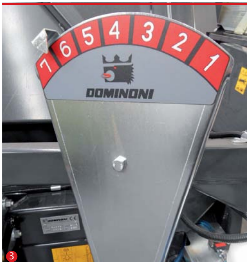
3 WSKAŹNIK Индикатор Pokazivač Индикатор